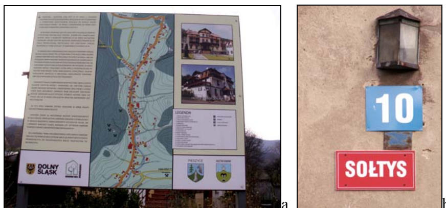
Fot. 1. Tablica informacyjna na temat sołectwa (a) i siedziba sołtysa Kamionek w Pieszycach (b) Photo 1. Notice board about the rural administrative unit and the residence of the village administrator of Kamionki in Pieszyce

1 – Śródmieście, Kuźniczka, Osiedle Piastów, Powstańców Śl., 2 – Pogorzelec, 3 – Kłodnica, Koźle-Port, Żabieniec, 4 – Stare Miasto, 5 – Osiedle Zachód, 6 – Rogi, 7 – Azoty, 8 – Błachownia Śląska, Lenartowice, 9 – Cisowa, 10 – Sławięcice, 11 – Miejsce Kłodnickie