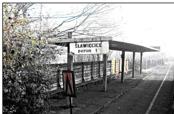
Fot. 2. Przystanek kolejowy Sławięcice w Kędzierzynie-Koźlu

Photo 2. The halt „Sławięcice” in Kędzierzyn-Koźle