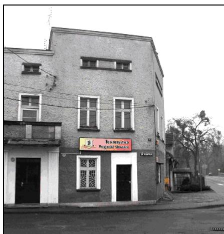
Fot. 11. Siedziba Towarzystwa Przyjaciół Sławięc w Kędzierzynie-Koźlu Photo 11. The office of the “Sławięce” Local Community Society in Kędzierzyn-Koźle

cowość), a nie całe miasto, czego przykładem jest Towarzystwo Przyjaciół Sławięc funkcjonujące na terenie miasta Kędzierzyn Koźle (fot. 11) czy Wiosna Cieplicka i sierpniowe Dni Sobieszowa odbywające się od kilkunastu lat w Jeleniej Górze i to niezależnie od głównego święta miasta, czyli Września Jeleniogórskiego. Dość częstym zjawiskiem jest również wydawanie lokalnej prasy (np. Gazeta Sławięcka czy gazetka Echo wydawana przez społeczność Sobieszowa) oraz prowadzenie portali internetowych poświęconych nie całemu miastu, a jego danej części (np. www.cieplice.zdroj.prv.pl , www.sobieszow.pl , www.cisowa.net , www.slawiecice.as.pl czy www.otmet.republika.pl ).