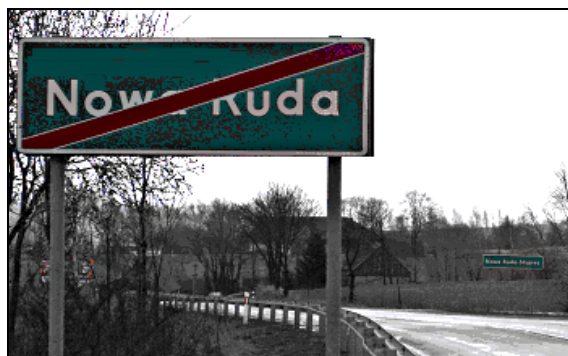
Fot. 4. Znaki drogowe między Nową Rudą a Słupcem

Photo 3. Road signs on the entrance to Otmęt (a – a part of Krapkowice) and Lenartowice (b – a part of Kędzierzyn-Koźle)