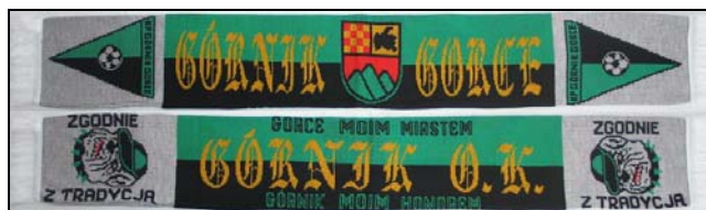
Fot. 10. Szaliki kibiców Górnika Gorce (Boguszów-Gorce) Photo 10. Scarves of „Górnika Gorce” fans (Boguszów-Gorce)

Szczególnym wyrazem aktywności społeczności lokalnych miejscowości pozbawionych samodzielności administracyjnej jest funkcjonowanie stowarzyszeń lokalnych (tab. 2) i organizacja imprez okolicznościowych reprezentujących dane osiedle (dawną miejscowość), a nie całe miasto, czego przykładem jest Towarzystwo Przyjaciół Sławięc funkcjonujące na te-