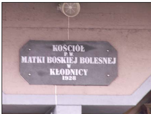
Fot. 8. Kościół p.w. Matki Boskiej Bolesnej w Kłodnicy (Kędzierzyn-Koźle) Photo 8. The church of Painful Mother of God in Kłodnica (Kędzierzyn-Koźle)