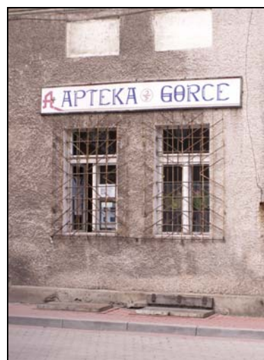
Fot. 7. Apteka Gorce w Boguszowie-Gorcach