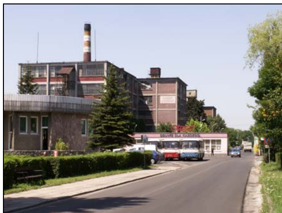
Fot. 9. Zakłady Obuwnicze Otmęt w Krapkowicach Photo 9. The shoes factory „Otmęt” in Krapkowice

ne, czyli atrakcje turystyczne leżące w granicach administracyjnych miasta Jelenia Góra.