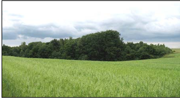
Fot. 4. Płat kwaśnej buczyny niżowej na tle rolniczego użytkowania obszaru

Photo 4. Patch of Deschampsio flexuosae-Fagetum typicum against a background of agricultural land use of the area