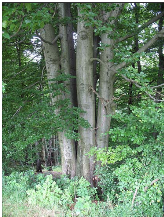
Fot. 9. Zrosnięte u podstawy okazy buka zwyczajnego Photo 9. Specimens of common beech Fagus sylvatica blended at the base