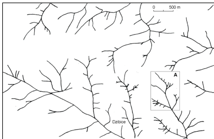
Rys. 2. Rozmieszczenie wąwozów i innych dolin erozyjno-denudacyjnych na obszarze badań – por. rys. 1 (wg mapy topograficznej 65):

A – fragment analizowanego wąwozu – por. rys. 3