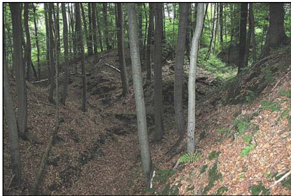
Fot. 5 i 6. Różne oblicza morfologiczne analizowanego wąwozu Photo 5 and 6. Different morphological faces of analysed gully