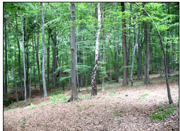
Fot. 8. Płat kwaśnej buczyny niżowej na wierzchowinie i przy górnej krawędzi wąwozu Photo 8. Patch of Deschampsio flexuosae-Fagetum at the flat-topped surface and at the upper scarp of gully

W drzewostanie dominuje buk z domieszką brzozy brodawkowatej ( Betula pendula ) (fot. 8 i 9).