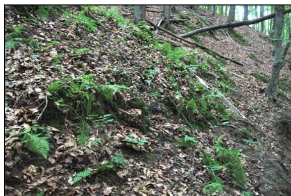
Fot. 10. Płat roślinności runa leśnego na zboczu analizowanego wąwozu Phot 10. Patch of vegetation of forest undergrowth at the slope of analysed gully

wystawach, ani na innych badanych elementach morfologicznych (wierzchowina i dno) (fot. 10). Zatem, na zboczu o wystawie E rośnie 5 gatunków wspomnianych roślin, które nie wymagają dużego nasłonecznienia. Stanowią je: dzwonek brzoskwiniolistny Campanula persicifolia , wierzbownica wzgórzowa Epilobium collinum , przytulinka wiosenna Cruciata glabra , przylaszczka pospolita Hepatica nobilis i Salix caprea . Jedynie na zboczu o ekspozycji SSW rośnie kostrzewa owcza Festuca ovina , potrzebująca więcej światła i bardziej przesuszonego podłoża, podobnie jak w przypadku zboczu o wystawie W, gdzie występuje ko-