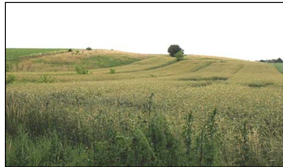
Fot. 1. Fragment niewysokiego progu lełowskiego (górnokredowego)

(skałkowych) okolic Huciska, Gorzkowa, Niegowy i Ogorzelika (około 400 m n.p.m.) do wideł Krztynia