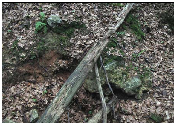
Fot. 3. Less na podłożu wapiennym (fot. T. Szczypek) Photo 3. Loess at the limestone substratum (phot. by T. Szczypek)

wierzchnie wapiennych skał podłoża. Źródłem materiału lessowego były pyły wywiewanego z rozległych powierzchni piaszczystych północnej części Górnego Śląska i doliny Warty, transportowane przez wiatry zachodnie na niewielkich wysokościach i na niewielkie odległości, akumulowane na podłożu wapiennym w cieniu wspomnianych wyniosłości skałkowych (RÓŻYCKI, 1960, 1978, 1982; MADEYSKA, 1982; BEDNAREK, HAISIG, WILANOWSKI, 1983; LEWANDOWSKI, 2011 i in.) (fot. 3).