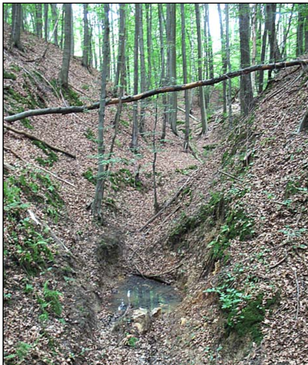
Fot. 7. Niewysoki próg skalny i kociołek eworsyjny wypełniony wodą Photo 7. Not very high rocky threshold and eversion hollow filled with water

W celu prześledzenia zależności między lokalną szatą roślinną a rzeźbą terenu – ekspozycją zboczy – wykonano pomiary i obserwacje w obrębie wierzchowiny (A – 3 stanowiska), dna wąwozu (B – 9 stanowisk) i na zboczach wąwozów (C – 18 stanowisk) o różnym nachyleniu i różnej ekspozycji (por. tab. 1).