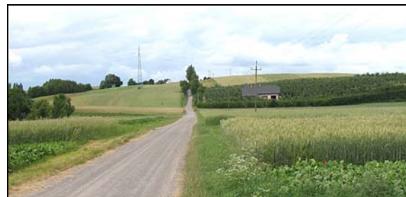
Fot. 2. Południowe stoki lełowskiej pokrywy lessowej koło Bodziejowic

Fig. 1. Lełów loess island (after RÓŻYCKI, 1982); A – location of gullies in the neighbourhood of area investigated (compare fig. 2)