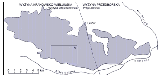
Rys. 1. Lełowska wyspa lessowa (wg RÓŻYCKIEGO, 1982); A – lokalizacja wąwozów w sąsiedztwie obszaru badań (por. rys. 2)

Photo 1. Fragment of not very high Lełów Threshold (cuesta) (Upper-Cretaceous) (phot. by T. Szczypek)