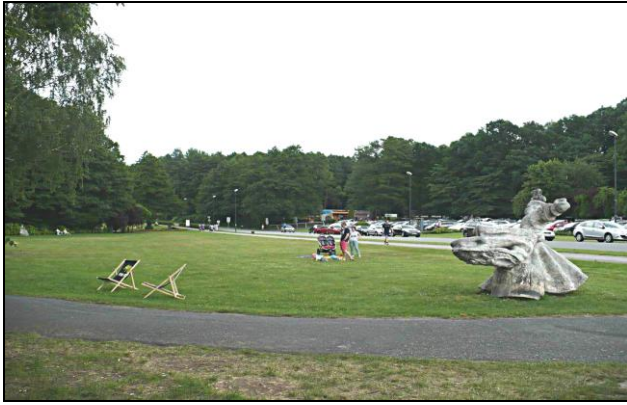
Fot. 2. Przestrzeń rekreacyjna w Katowicach-Muchowcu

Фот. 2. Рекреационное пространство в Катовице-Муховце