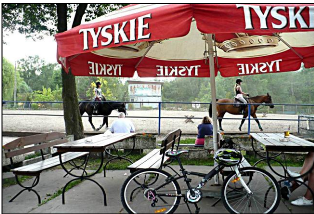
Fot. 3. Ośrodek jeździecki w Katowicach-Muchowcu

Photo 2. Recreation area in Katowice-Muchowiec