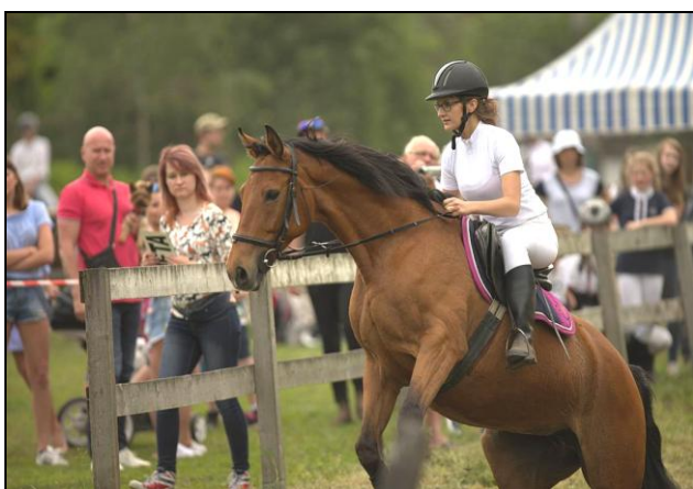
Fot. 1. Rekreacyjne zawody jeździeckie Фот. 1. Рекреационные конноспортивные соревнования Photo 1. Recreational horse riding competition

Duża liczba jeźdźców na stosunkowo małym obszarze Katowic i miast sąsiadujących zaowocowała 18 lat temu utworzeniem Towarzystwa Miłośników Rekreacji Konnej „Hubert”, które nieprzerwanie stara się integrować środowisko jeźdźców i propagować rekreację i turystykę konną. Z uwagi na status stowarzyszenia (non-profit), jego możliwości są znacznie ograniczone. Pomimo tego, corocznie organizuje dwie duże towarzyskie imprezy jeździeckie w postaci zawodów rekreacyjnych (fot. 1) z okazji rozpoczęcia sezonu jeździeckiego (w maju) oraz tradycyjny bieg hubertusowy stanowiący zakończenie sezonu. Hubertusy TMRK są unikatowe w skali co najmniej regionalnej, gdyż rozpoczynają się uroczystą mszą św. w parku przy bazylice oo. Franciszkanów w Katowicach-Panewnikach. Biorą w niej udział jeźdźcy wraz z końmi, a po mszy ma miejsce przemarsz kolumny jeźdźców na pola w Lasach Panewnickich, gdzie odbywa się tradycyjna pogoń za lisem.