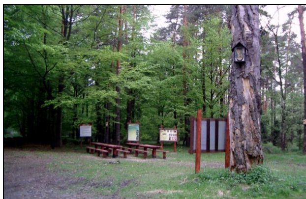
Fot. 8. Miejsce do wypoczynku na ścieżce edukacyjnej Фот. 8. Место для отдыха на образовательной тропе Photo 8. A place to relax on the educational path

Dodatkowo, w połowie trasy przebiegu ścieżki edukacyjnej, na śródlęsnej polanie przygotowano miejsce do odpoczynku, które wyposażono w ławki i tablice informacyjne (fot. 8).