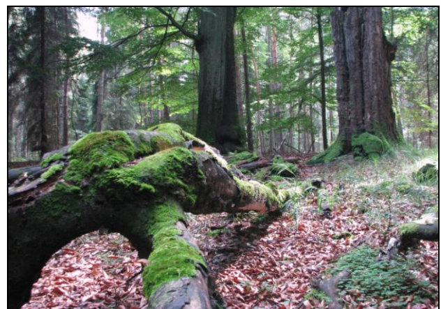
Fot. 4. Płat Luzulo pilosae-Fagetum w rezerwacie „Babczyzna Dolina” ( 7.08.2014) Фот. 4. Фитоценоз Luzulo pilosae-Fagetum в резервате „Бабчина Долина” ( 7.08.2014) Photo 4. Phytocoenosis of Luzulo pilosae-Fagetum in the "Babczyzna Valley" nature reserve ( 7.08.2014)

Na omawianym obszarze stwierdzono trzy płaty tego zespołu, związane z lokalnymi wyniesieniami terenu. Charakteryzują się dominacją buka Fagus sylvatica i ubogą gatunkowo warstwą zielną, której główne gatunki to borówka czernica Vaccinium myrtillus , podagrycznik pospolity Aegopodium podagraria , turzyca drżączkowata Carex brizoides i śmiełek pogięty Deschampsia flexuosa . Warstwę mszystą tworzy głównie złotowłos strojny Polytrichastrum formosum . W płacie tego zespołu, zlokalizowanym w rezerwacie „Babczyzna Dolina”, stwierdzono występowanie starych okazałych buków oraz martwych, leżących kłód, co sprawia wrażenie dzikości i decyduje o walorach ekoturystycznych doliny Korzeńca (fot. 4).