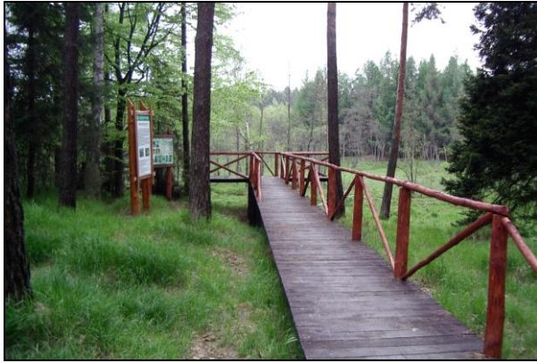
Fot. 8. Pomost widokowy zlikwidowany w 2014 roku