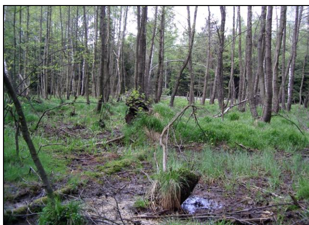
Fot. 2. Płat Sphagno squarrosi-Alnetum w rezerwacie „Babczyna Dolina”

Płaty zespołu kształtują się w zabagnionym fragmencie doliny w rezerwacie „Babczyna Dolina”. Cechują się niewyraźną strukturą kępkowo-dolinkową (fot. 2).