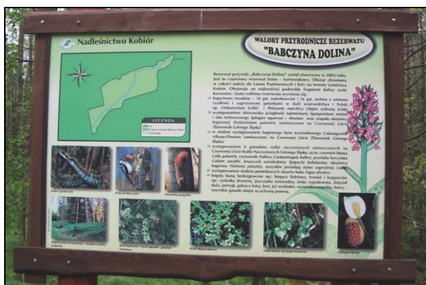
Fot. 7. Tablica informacyjna w sąsiedztwie rezerwatu „Babczyna Dolina” Фот. 7. Информационный щит в окрестностях резервата „Бабчина долина” Photo 7. Information board in the vicinity of the "Babczyna Dolina" reserve

czenie dla edukacji ekologicznej poprzez zaprezentowanie najważniejszych procesów i zjawisk zachodzących w ekosystemach leśnych oraz możliwość zapoznania się z walorami przyrodniczymi rezerwatu „Babczyna Dolina” (fot. 7).