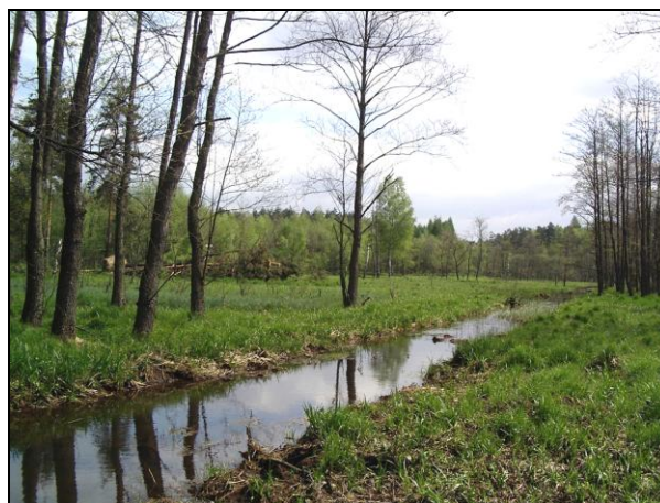
Fot. 1. Potok Korzeniec Południowy w rezerwacie „Babczyzna Dolina”