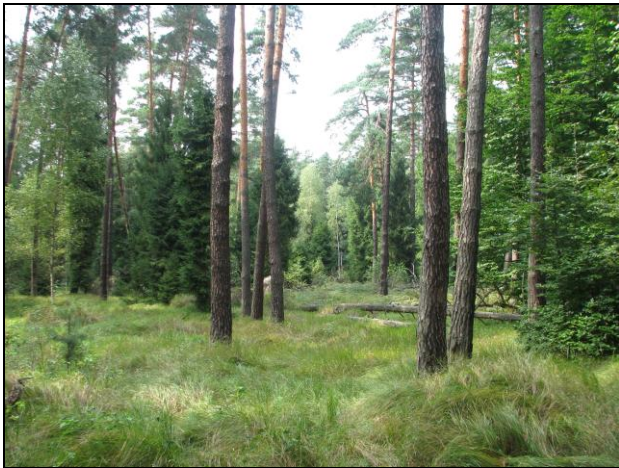
Fot. 3. Płat Calamagrostio villosae-Pinetum w rezerwacie „Babczyzna Dolina” Фот. 3. Фитоценоз Calamagrostio villosae-Pinetum в резервате „Бабчина долина” Photo 3. Phytocoenosis of Calamagrostio villosae-Pinetum in the "Babczyzna Valley" nature reserve

Rozległe płaty bagiennego boru trzcinnikowego stwierdzono w północnej części gminy Suszec na prawym brzegu Korzeńca Południowego (fot. 3). Wykształciły się one na wilgotnym, nierównym podłożu, bez wyraźnej ekspozycji. W warstwie drzew dominują sosna pospolita Pinus sylvestris i często nasadzany na tym siedlisku modrzew europejski Larix decidua . O trawiastej fizjonomii runa w głównej mierze decydują: trzcinnik owłosiony Calamagrostis villosa i śmiełek pogięty Deschampsia flexuosa . Niedużym, ale wyraźnym pokryciem charakteryzuje się natomiast rzadka w województwie śląskim przytulia hercyńska Gallium saxatile . W warstwie mszystej największą rolę odgrywa rokitnik pospolity Pleurozium schreberi , któremu towarzyszą złotowłos strojny Polytrichastrum formosum i widłoząb miotłowy Dicranum scoparium .