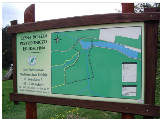
Fot. 6. Tablica informacyjna przy ścieżce edukacyjnej