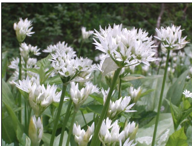
Fot. 5. Czosnek niedźwiedzi Allium ursinum

W trakcie badań rozpoznano dwa płaty zespołu, przywiązane do miejsc płaskich. Dominantem warstwy drzew i podszytu jest lipa drobnolistna Tilia cordata , z domieszką innych gatunków (tab. 1). Głównymi komponentami warstwy zielnej są podagrycznik pospolity Aegopodium podagraria , turzycza drżączkowata Carex brizoides oraz nalot lipy. W jednym z płatów, w sąsiedztwie drogi leśnej, wiosną, zaobserwowano licznie występujący, częściowo chroniony czosnek niedźwiedzi Allium ursinum (fot. 5).