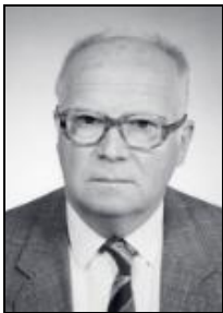
RNDr, DrSc Tadeáš Czudek 1932–2017 Instytut Geografii Cze- chosłowackiej AN, In- stytut Geografii Czes- kiej AN, Brno, Czechy