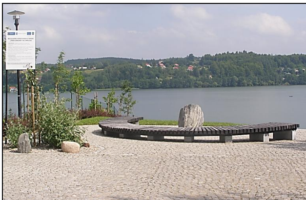
Fot. 1. Park Kamienny w Chmielnie

w Chmielnie, Kartuzach, Sierakowicach i Somonie, jak również Starostwo Powiatowe w Kartuzach. Beneficjentką była także osoba prywatna, prowadząca „Dworek Oleńka”, oraz Parafia Rzymsko-Katolicka p.w. Wniebowzięcia NMP w Kartuzach.