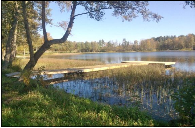
Fot. 2. Zagospodarowanie turystyczne nad jeziorami Mienino w Łyśniewie na terenie gminy Sierakowice Фот. 2. Развитие туризма на озере Миенино и в Лысьневе на территории общины Сераковице Photo 2. Touristic development to the lakes: Mienino in Łyśniewo in the commune of Sierakowice