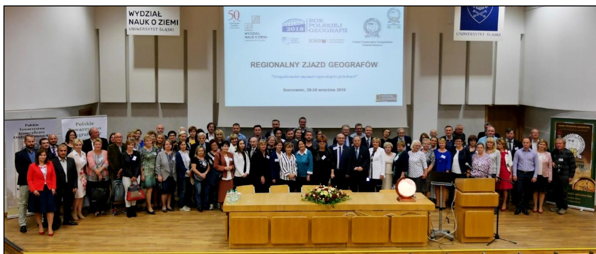
Rys. 7. Uczestnicy Regionalnego Zjazdu Geografów w Sosnowcu (28–30 września 2018) Рис. 7. Участники Регионального географического съезда в Сосновце (28–30 сентября 2018) Fig. 7. Participants of the Regional Geographical Congress in Sosnowiec (September 28–30, 2018)

Ważnym zadaniem dla Polskiego Towarzystwa Geograficznego zawsze była popularyzacja nauk geograficznych. Oddział Katowicki przez wszystkie lata swojej działalności oferował różne formy zajęć, które miały służyć temu zadaniu. Do najważniejszych propozycji popularyzujących wiedzę geograficzną należy zaliczyć naukowe odczyty oraz prelekcje z cyklu Podróże po świecie . Prelegenci – głównie wykładowcy z WNoZ UŚ – mają okazję podzielenia się wynikami prowadzonych badań oraz zrelacjonowania krajowych i zagranicznych wojaży. Uczestnikami wykładów są głównie nauczyciele, przychodzący na spotkania wraz z uczniami. Bywały lata, kiedy liczba słuchaczy tych wykładów sięgała 2 tys. osób w ciągu roku. Inną formą popularyzacji wiedzy geograficznej były wykłady dla uczniów szkół średnich Geograficzne spotkania pod globusem w Sosnowcu lub w kołach terenowych. W ostatnich latach – przy pełnej auli na WNoZ – odbywały się wykłady przygotowywane przez członków Oddziału (Marek Ruman, Anna Runge, Martyna Rzętała, Sławomir Sitek, Józef Soja, Elżbieta Zuzańska-Żyśko) w ramach Wieczoru z geografiami przed maturą (rys. 8), oraz warsztaty, pokazy i konkursy z okazji Dnia Geografa , organizowane wspólnie z WNoZ UŚ.