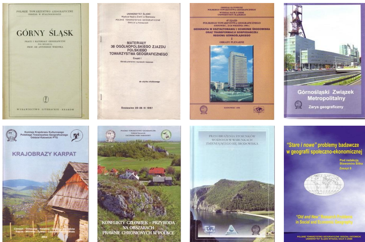
Rys. 3. Okładki wybranych publikacji wydanych z afiliacją Oddziału Katowickiego PTG Рис. 3. Обложки отдельных публикаций, изданных при участии Катовицкого отделения ПГО Fig. 3. Covers of selected publications issued with the affiliation of the Katowice Branch of the PGS

Oddział Katowicki PTG opublikował różnorodne materiały z okazji zjazdów i konferencji naukowych, najczęściej wspólnie z innymi instytucjami i z komisjami problemowymi PTG. Były to m.in. następujące opracowania: TREMBACZOWSKI (1987), RZĘTAŁA, SZCZYPEK (1998), JANKOWSKI, MYGA-PIĄTEK, OSTAFICZUK (2000), MYGA-PIĄTEK (2001, 2003, 2004), HIBSZER (2003), SZCZYPEK, RZĘTAŁA (2003), JANKOWSKI, RZĘTAŁA (2004, 2005), MYGA-PIĄTEK, CAPUTA (2004), HIBSZER, PARTYKA (2005a, b), DULIAS, HIBSZER (2008), KONOPACKI, SKRZYŃSKA (2008), JANKOWSKI, ABSALON, MACHOWSKI, RUMAN (2009), HIBSZER, SZKURŁAT (2018) (rys. 3). Z afiliacją Oddziału Katowickiego opublikowano także indywidualne prace członków Oddziału (np. MALETA, 2003; KŁYS, 2004) oraz opracowania jubileuszowe, dedykowane osobom zasłużonym dla PTG (np. DWUCET, SZCZYPEK, 1995; SZCZYPEK, RZĘTAŁA, 2003; ABSALON, HIBSZER, 2008).