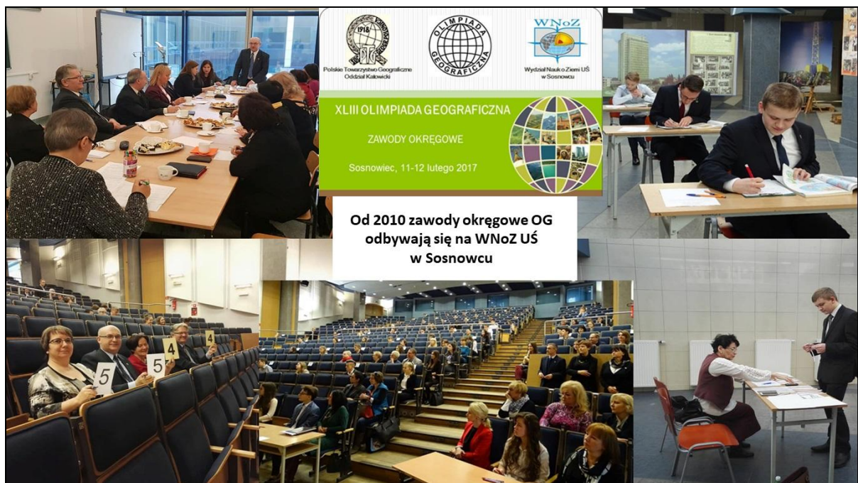
Rys. 9. Olimpiada geograficzna – „ukochane dziecko” Polskiego Towarzystwa Geograficznego Рис. 9. Географическая олимпиада – „любимый ребенок” Польского географического общества