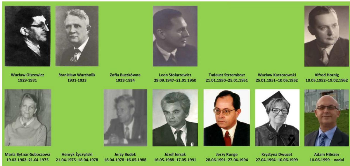
Rys. 2. Przewodniczący Oddziału Śląskiego i Katowickiego PTG

Działalność naukowa w pierwszym okresie istnienia Oddziału była związana z Instytutem Śląskim, z którego wywodzili się członkowie założy-