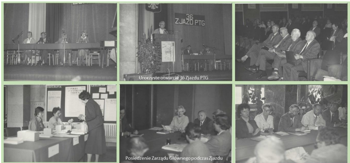
Rys. 6. Ogólnopolski 36 Zjazd PTG (Sosnowiec, 24–26 września 1987)

Regionalny 7. Zjazd PTG na temat Górnośląskiego Okręgu Przemysłowego odbył się 28–29 maja 1955 r. w Katowicach. Regionalny 20. Zjazd PTG poświęcony Problematyce geograficznej Rybnickiego Okręgu Węglowego odbył się w dniach 27–29 czerwca 1969 r. także w Katowicach. Natomiast Ogólnopolski 36. Zjazd PTG zorganizowano w dniach 24–26 września 1987 r. w Sosnowcu pod hasłem „Zadania nauk geograficznych w kształtowaniu środowiska naturalnego” (rys. 6). W zjeździe uczestniczyło 350 osób, w tym 21 gości zagranicznych. Na Wydziale Nauk o Ziemi UŚ w Sosnowcu zorganizowano w dniach 23–26 września 1998 r. 47. Ogólnopolski Zjazd PTG pod hasłem „Geografia w kształtowaniu i ochronie środowiska oraz transformacji gospodarczej regionu górnośląskiego”. W zjeździe wzięło udział 300 osób z kraju i z zagranicy.