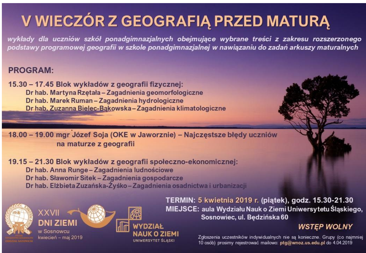
Rys. 8. Plakat z programem „Wieczoru z geografią przed maturą” w 2019 r. – przykład działalności popularyzującej wiedzę geograficzną