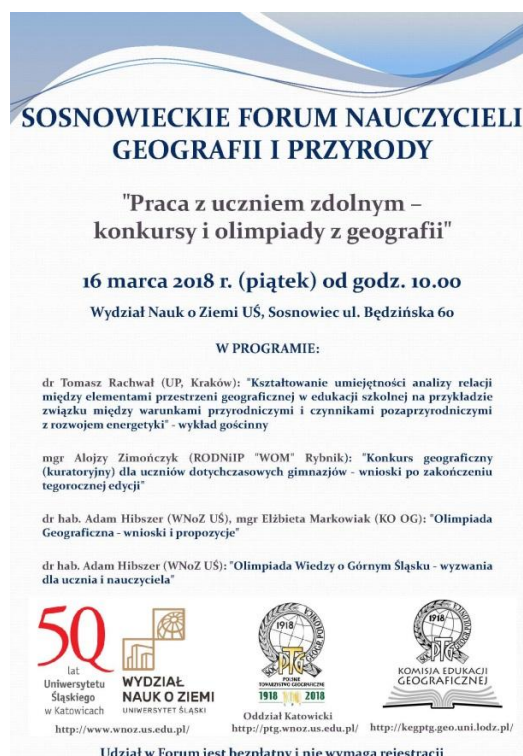
Rys. 4. Programy Sosnowieckiego Forum Nauczycieli Geografii – przykład działalności edukacyjnej Oddziału Katowickiego PTG