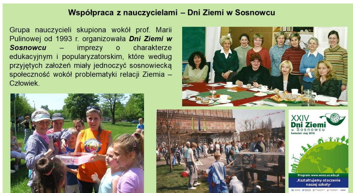
Rys. 5. Dni Ziemi w Sosnowcu – przykład działań edukacyjnych Oddziału